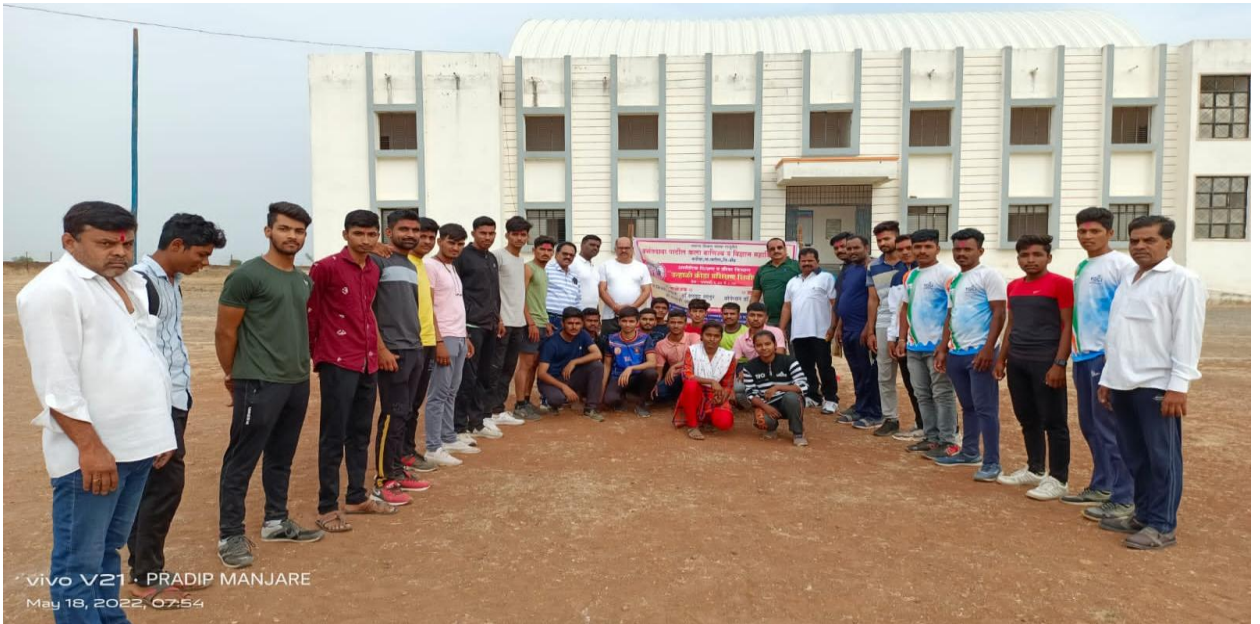
Inauguration of Summer Sports Coaching Camp.