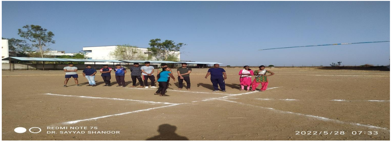
Practice of Javelin Throw in Summer Sports Coaching Camp