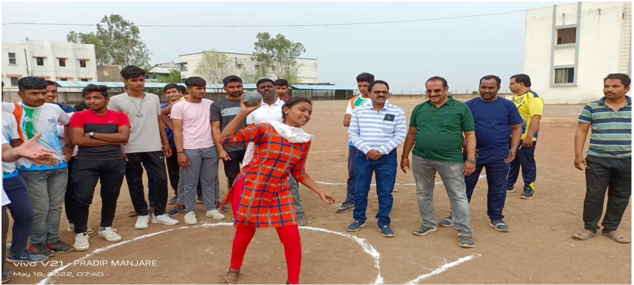
Practice of shot put in Summer Sports Coaching Camp