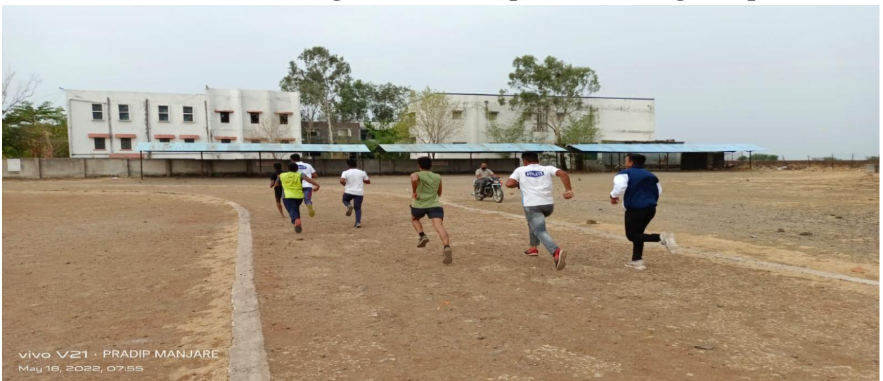
Practice of Running in Summer Sports Coaching Camp