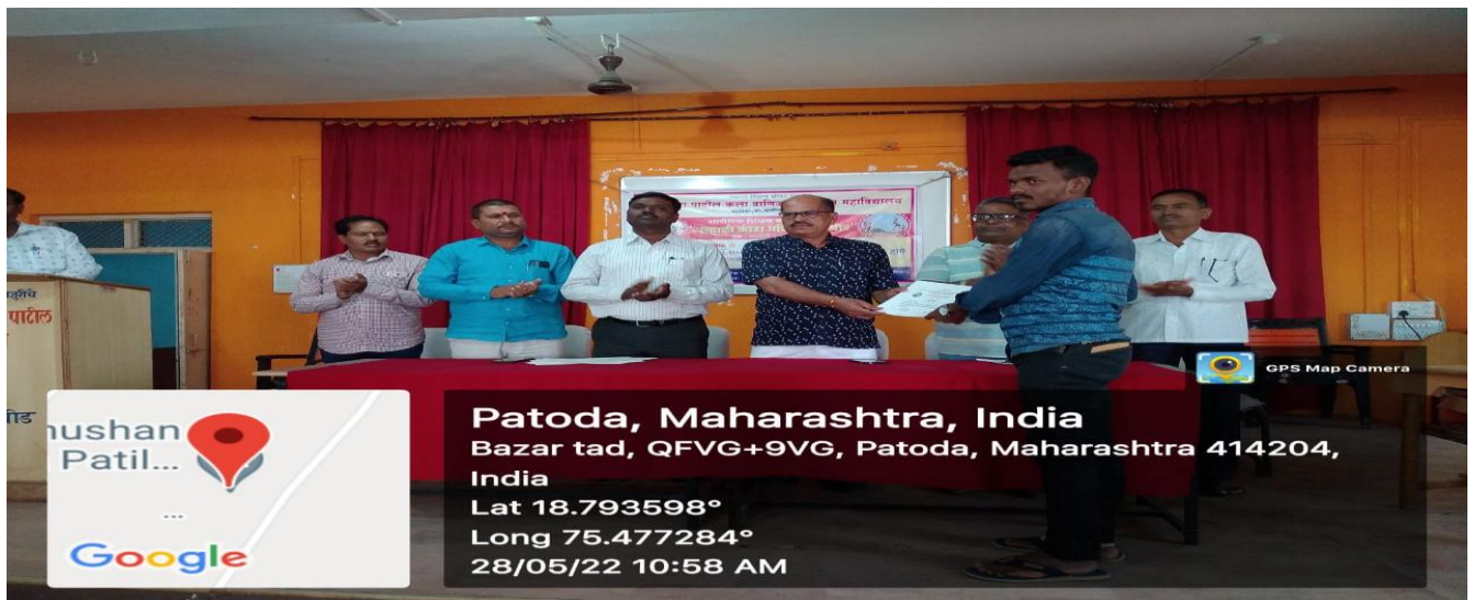
Certificate Distribution of Summer Sports Coaching Camp