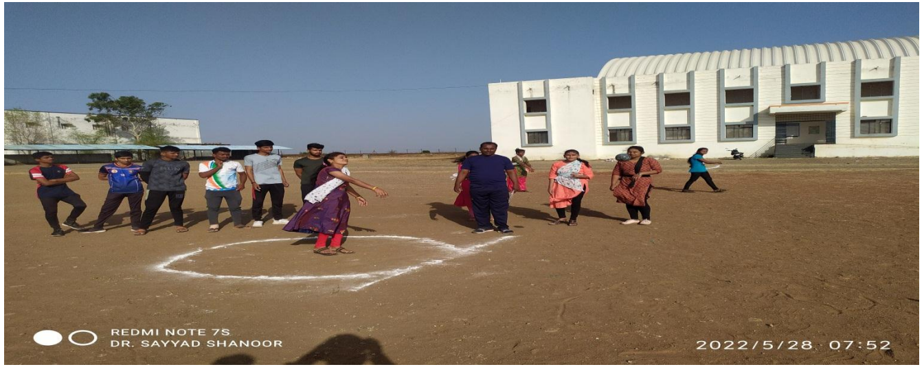
Practice of shot put in Summer Sports Coaching Camp