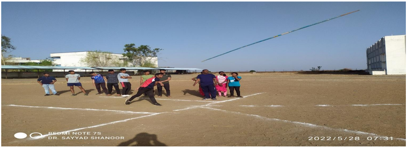
Practice of Javelin Throw in Summer Sports Coaching Camp