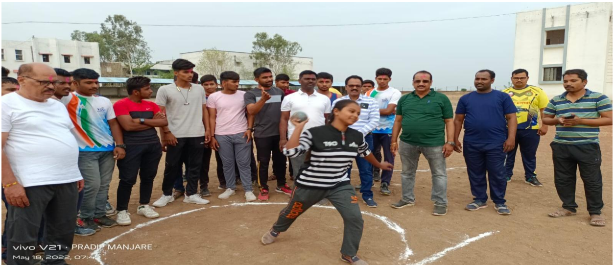
Practice of shot put in Summer Sports Coaching Camp