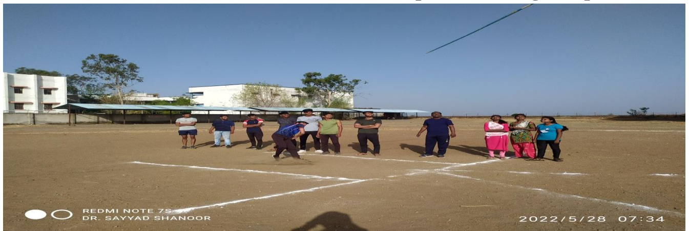
Practice of Javelin Throw in Summer Sports Coaching Camp