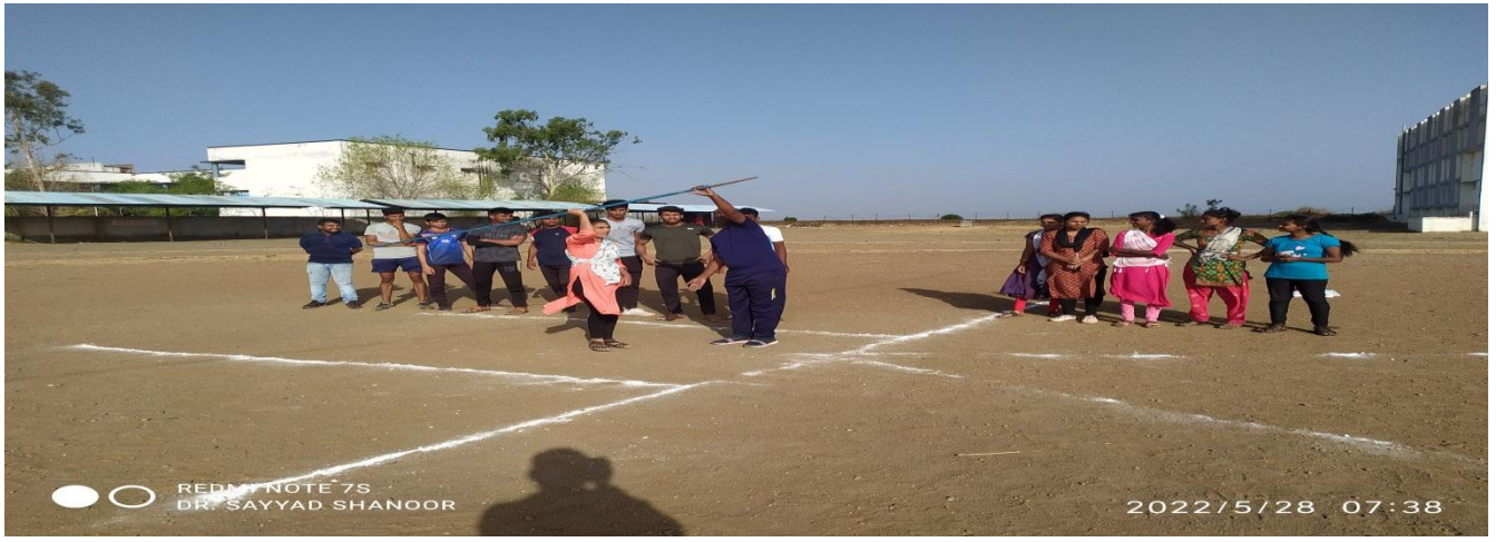
Practice of Javelin Throw in Summer Sports Coaching Camp