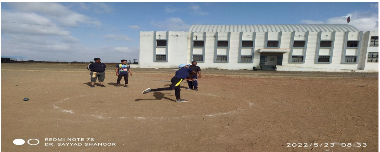
Practice of Discus Throw in Summer Sports Coaching Camp