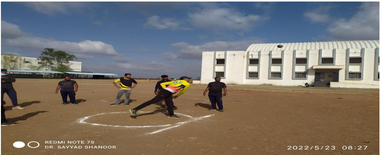
Practice of shot put in Summer Sports Coaching Camp