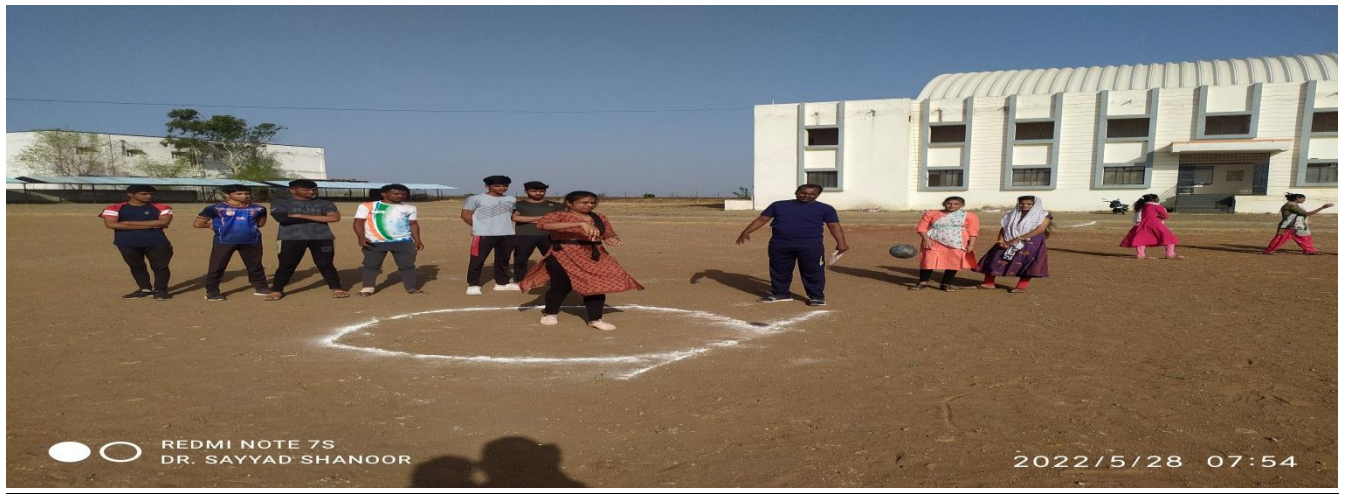
Practice of shot put in Summer Sports Coaching Camp