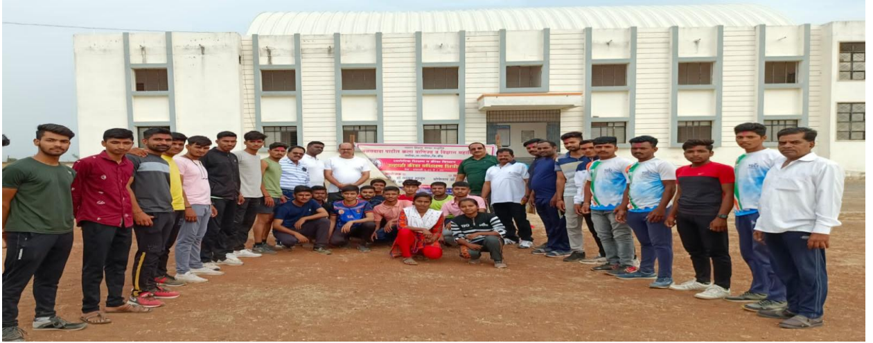
Inauguration of Summer Sports Coaching Camp.