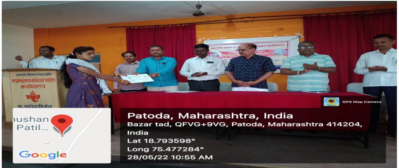
Certificate Distribution of Summer Sports Coaching Camp