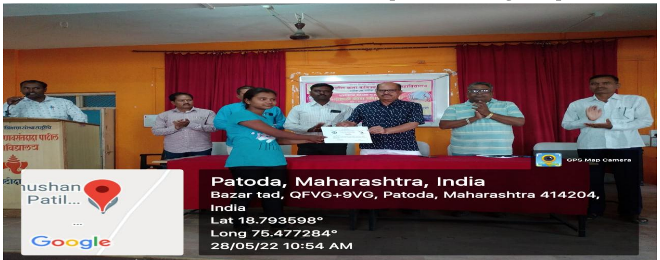
Certificate Distribution of Summer Sports Coaching Camp