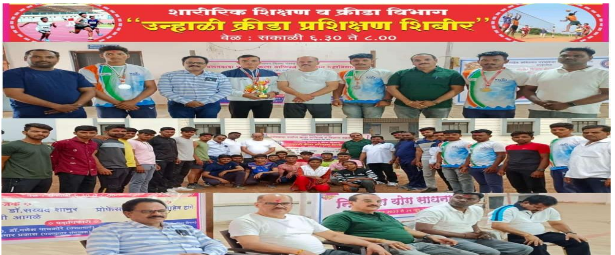
Inauguration of Summer Sports Coaching Camp.