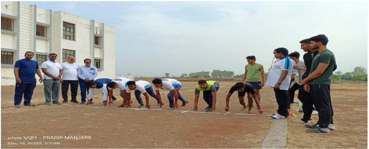
Practice of Running in Summer Sports Coaching Camp