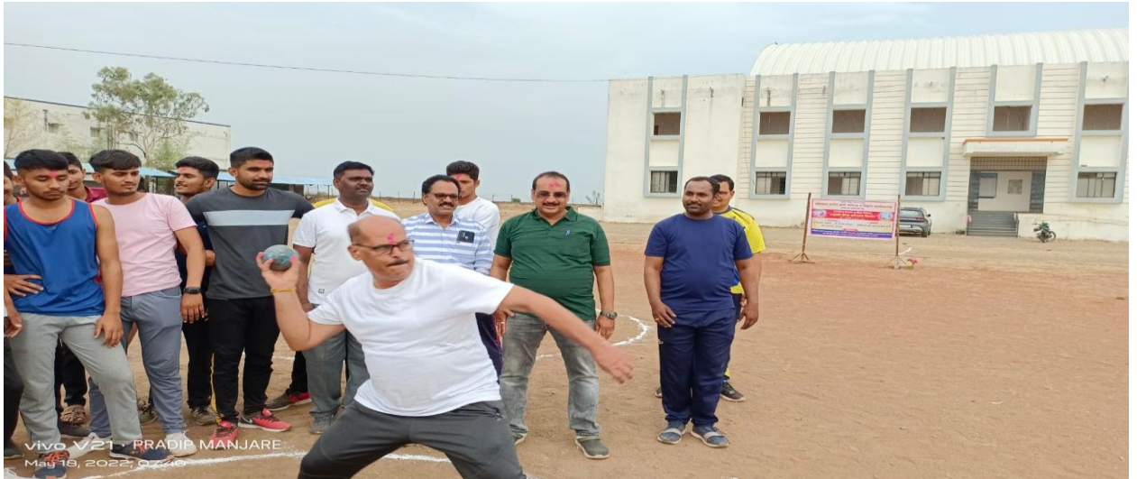
Principal actively Participated in Summer Sports Coaching Camp.