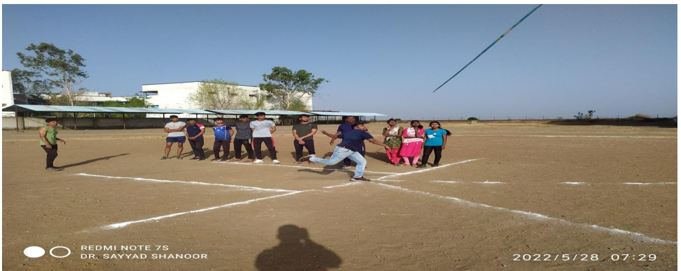
Practice of Javelin Throw in Summer Sports Coaching Camp