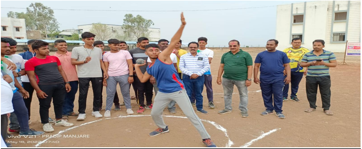
Practice of shot put in Summer Sports Coaching Camp