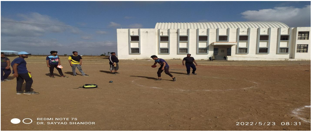
Practice of Discus Throw in Summer Sports Coaching Camp