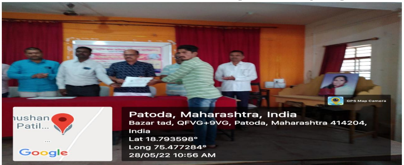
Certificate Distribution of Summer Sports Coaching Camp