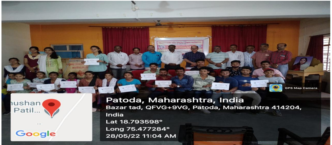
Certificate Distribution of Summer Sports Coaching Camp