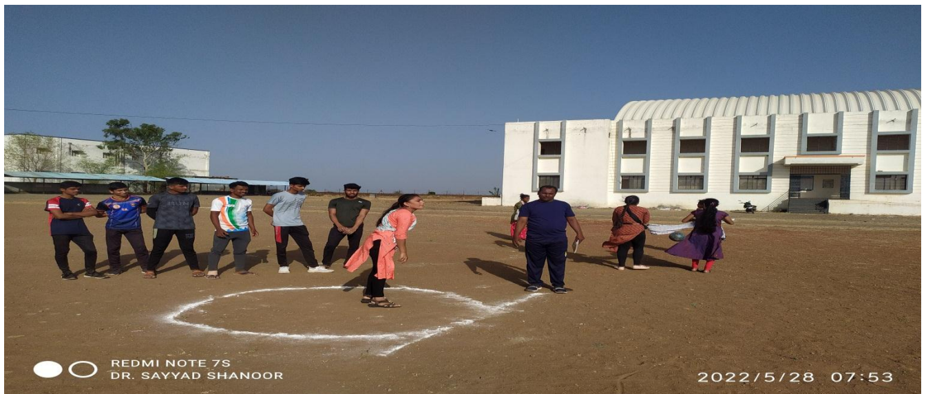
Practice of shot put in Summer Sports Coaching Camp