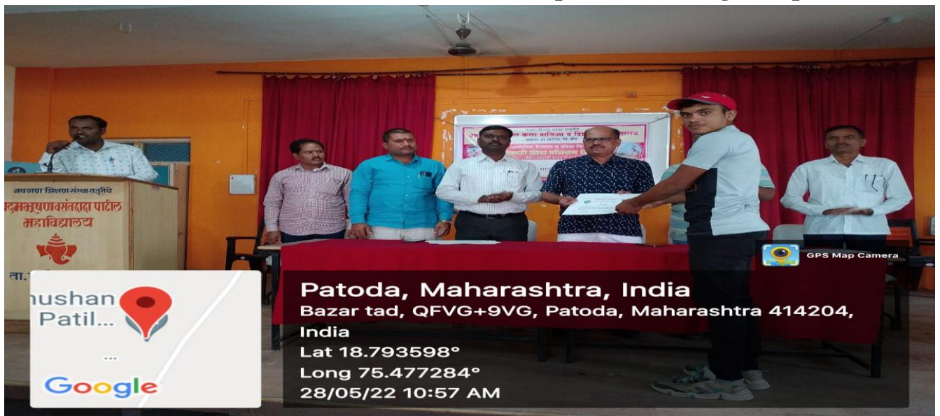
Certificate Distribution of Summer Sports Coaching Camp