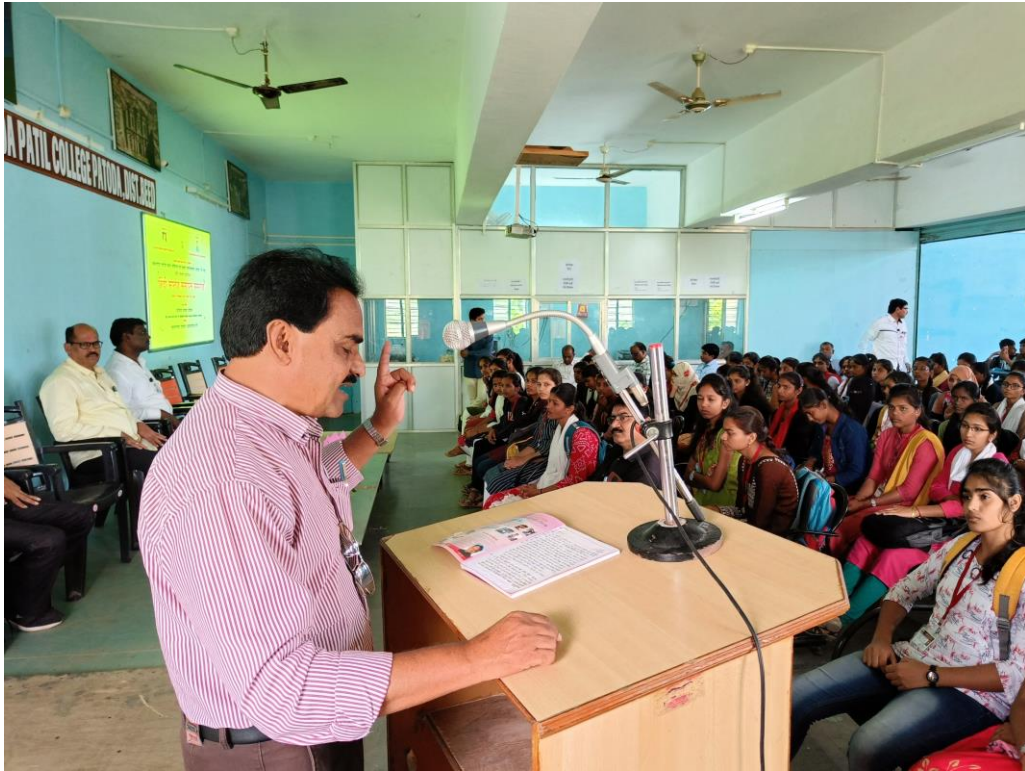
CHIEF GUEST PROFESSOR SAYYAD SHAUKAT DELIVERING SPEECH AT HINDI SAPTAH