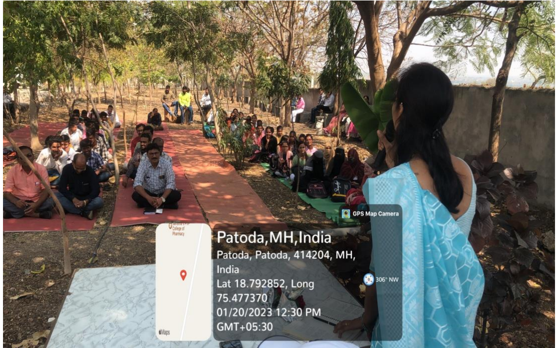
विद्यार्थ्यांना मार्गदर्शन करताना व आपल्या कवितांचा बहारदार कार्यक्रम सदर करताना