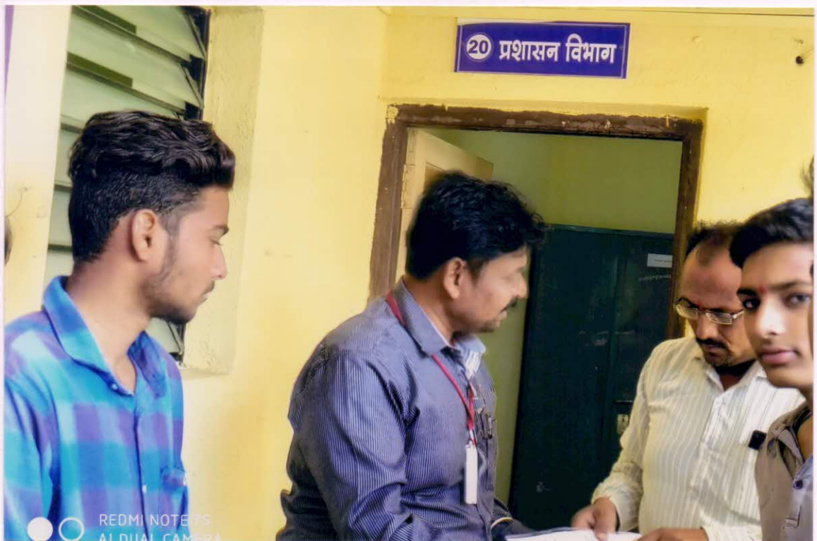
प्रशासकीय विभागाचा भेट देत असताना प्रा. मंजरे सर व विद्यार्थी.