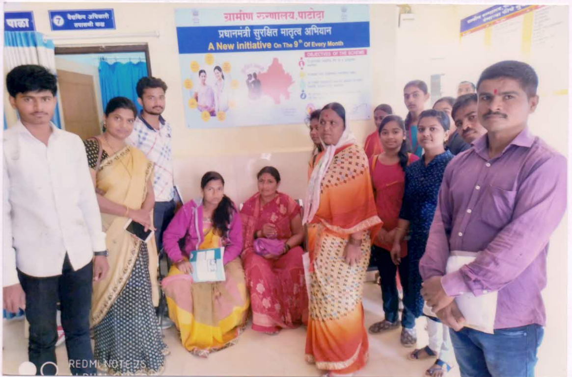
रुग्णालयाने अर्थीकर तपासणीसाठी आलेल्या पेशंट सोबत चर्चा त्यांच्या कडून रुग्णालयातील सुविधा, कर्मचारी वर्ग या संदर्भात साहजिक घेण्यात आली.