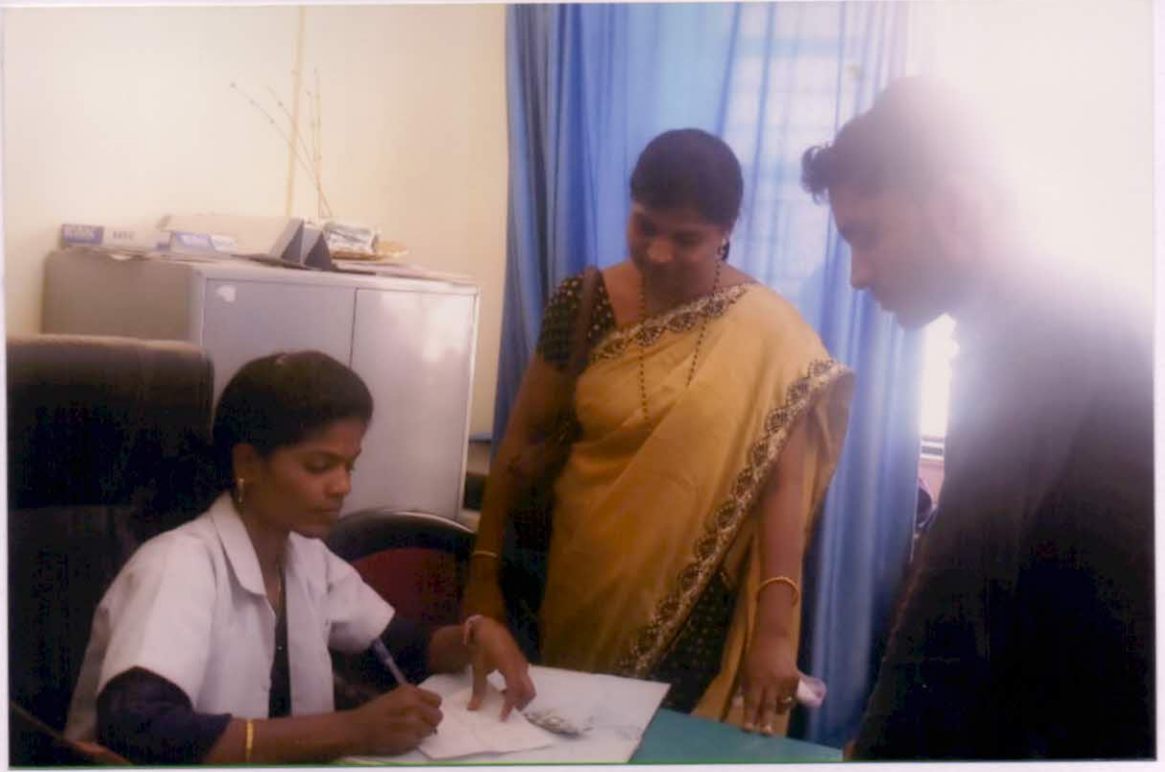
ग्रामीण रुग्णालय पाटीदा येथील इतर वैद्यकीय अधिकारी, नर्स यांच्या सोबत मोटेवजरी.